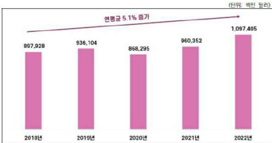
글로벌 음료 시장규모